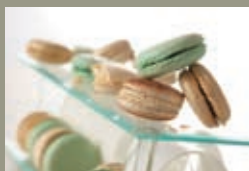
Assortiment de macarons