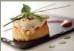
Tarte fine au thon et mozzarella